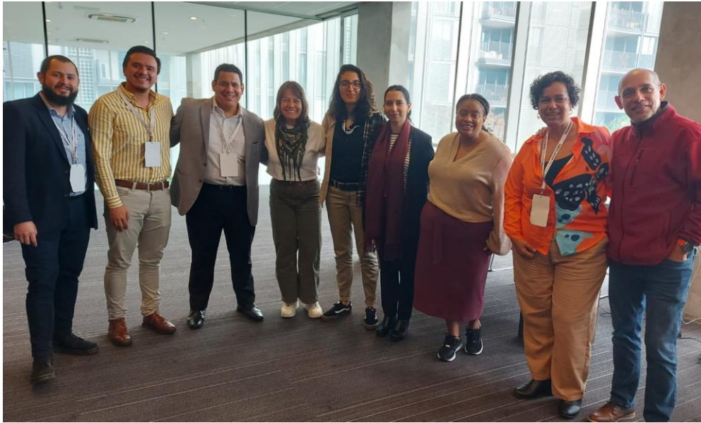
Fotografía No. 9. Delegación costarricense participante en Abrelatam y Condatos 2023. Octubre-Noviembre de 2023.

En este año también se empezaron las labores para el rediseño del portal de datos abiertos del Poder Judicial, el cual se encuentra alojado en la plataforma CKAN, reconocida internacionalmente por cumplir con los estándares para este tipo de sitios web. Este trabajo se está haciendo mediante la aplicación de metodologías innovadoras centradas en las perspectivas y experiencias de las personas usuarias.