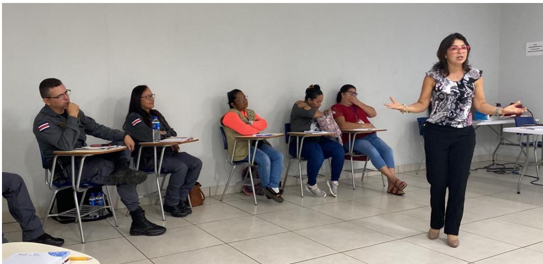
Fotografía No. 23. Taller sobre delito de trata de personas. Zona Norte. Julio de 2023.

En estas jornadas participó personal de la Defensa Pública, Fiscalía, Organismo de Investigación Judicial, Juzgado Contravencional, Juzgado Penal, así como personas facilitadoras judiciales de Los Chiles, Guatuso y Upala.