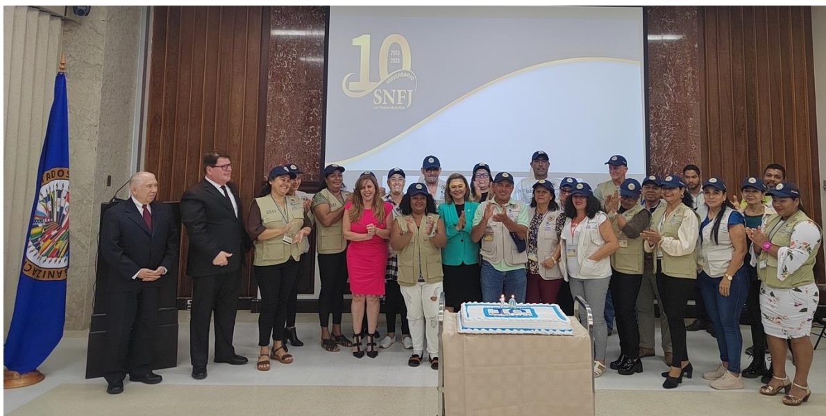
Fotografía No. 15. Conmemoración del 15º. Aniversario del SNFJ. Corte Suprema de Justicia. Julio de 2023.

Para esta actividad se preparó un material audiovisual que rescata parte de la memoria histórica de los primeros pasos del Servicio Nacional, narrada por algunas personas protagonistas que impulsaron o participaron de esos momentos. El video está disponible en: https://www.youtube.com/watch?v=l8LyVBnsJVg