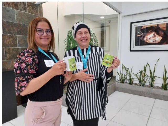
Fotografía No. 7. Representantes de sociedad civil ante Comisión de Justicia Abierta. Marzo de 2023.

La sesión también se aprovechó para actualizar información sobre el proceso de formulación del compromiso del Poder Judicial para el V Plan de Acción de Estado Abierto, los procesos de consulta virtual y presencial que se están llevando a cabo en el país.