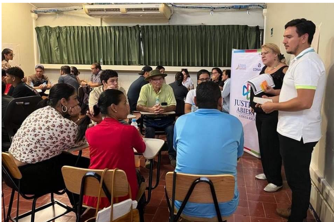
Fotografía No. 11. Taller con ciudadanía para la construcción del V Plan de Acción de Estado Abierto. Febrero de 2023.

El trabajo en la construcción de este plan incluyó una consulta ciudadana en el mes de febrero para identificar los temas que sugiere la población deben ser abordados. El siguiente paso en este proceso fue la realización de talleres participativos en el mes de marzo en diferentes puntos del país tales como Golfito, Aguas Zarcas, Limón y San José, en donde mediante reuniones presenciales y una metodología participativa, las personas y representantes de entidades públicas conversaron sobre las problemáticas y definieron prioridades con ciudadanía.