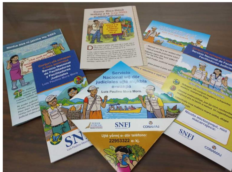
Fotografía No. 21. Muestra de materiales impresos en lenguas indígenas Bribri y Maleku. Noviembre de 2023.

Durante 2023 se trabajó en la continuidad del proyecto de elaboración de materiales del SNFJ para las personas facilitadoras judiciales indígenas, en esta segunda parte se priorizaron los idiomas Bribri y Maleku.