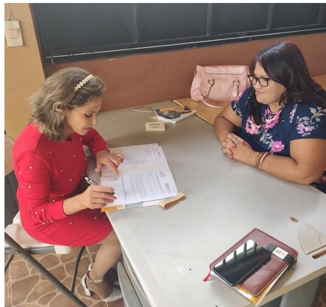
Fotografía No. 16. Nombramiento de primera persona facilitadora de Acosta. Agosto de 2023.

Además de este nombramiento, se han realizado nombramientos en otras comunidades de Acosta y León Cortés, así como visitas para la divulgación y formación en acceso a la justicia en comunidades rurales de Acosta y la zona de Los Santos.