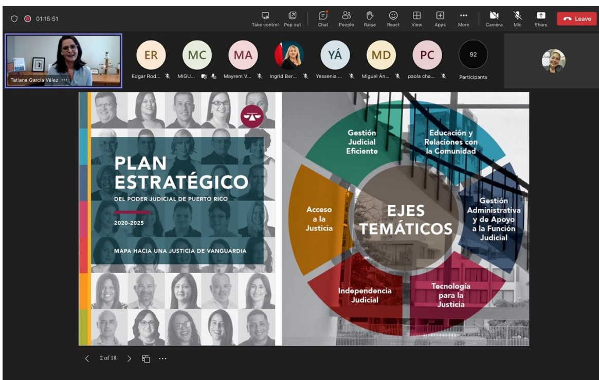
Fotografía No. 10. Foro virtual “Actualidad de la Justicia Abierta en América: Iniciativas Innovadoras”. Mayo de 2023.

En el marco de la Semana Global del Gobierno Abierto, este grupo especializado organizó el 9 de mayo el foro virtual “Actualidad de la Justicia Abierta en América: Iniciativas Innovadoras”, con el fin de fortalecer los lazos internacionales, intercambiar conocimientos y profundizar en prácticas de justicia abierta en la región latinoamericana.