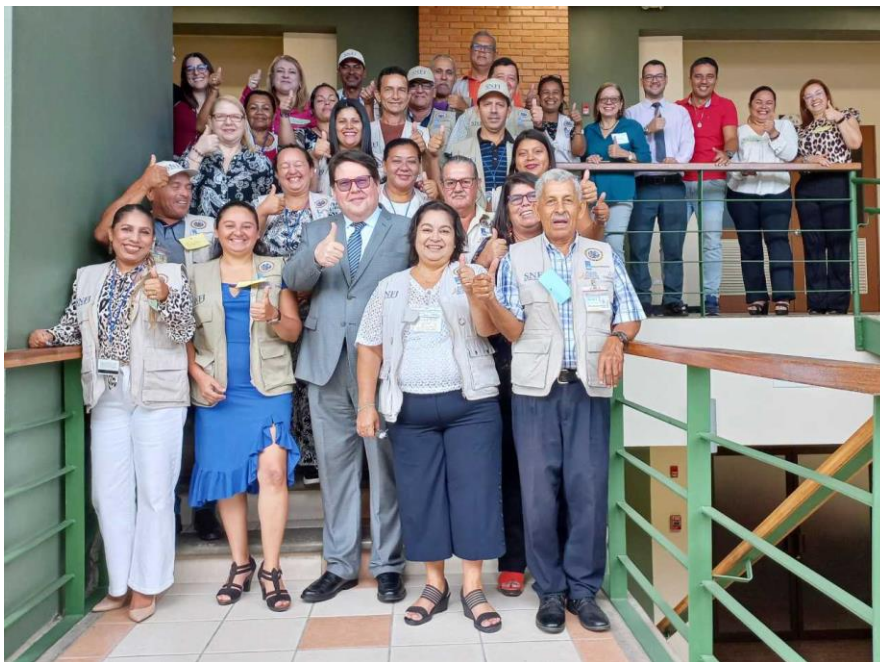
Fotografía No. 18. Taller Mediación Comunitaria con enfoque restaurativo dirigido a personas facilitadoras judiciales. San José. Mayo de 2023.

Se estima por parte de ambos países llevar esta capacitación a las personas facilitadoras judiciales de sus respectivos territorios en el año 2024.