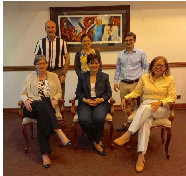
Fotografía No. 27. Círculo de Diálogo con Magistradas y Magistrados del Tribunal Supremo de Elecciones. Setiembre de 2023.