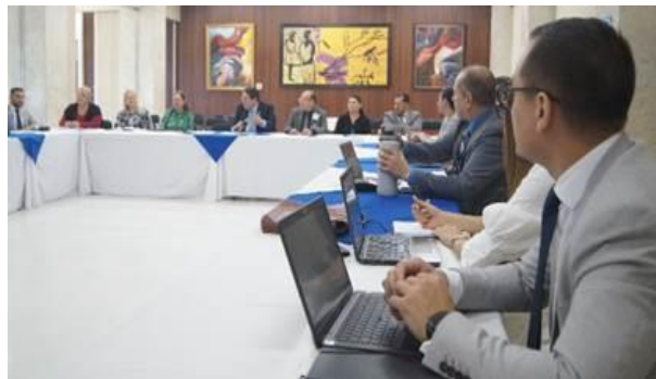
Fotografía No. 6. Sesión de Comisión de Justicia Abierta. Febrero de 2023.

Esta comisión sesionó los días 21 de febrero, 8 de junio, 22 de agosto y la última el 21 de noviembre. La primera sesión se realizó presencialmente el 21 de febrero y contempló como puntos de agenda la presentación de resultados de la investigación sobre el fortalecimiento de la participación ciudadana, consultoría ejecutada el año anterior. La empresa consultora a cargo del proyecto presentó un resumen sobre los objetivos, metodologías utilizadas, alcances, hallazgos obtenidos y recomendaciones que desde el equipo consultor se identificaron según los niveles de participación ciudadana establecidos en la política institucional.