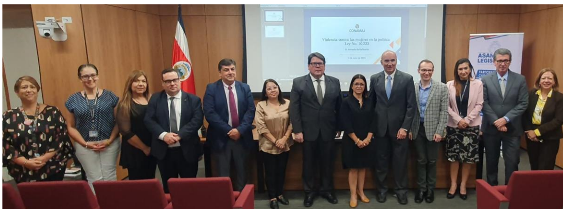
Fotografía No. 1. Jerarcas y personal profesional de Instituciones Conamaj. III Jornada de Reflexión. Asamblea Legislativa. Julio de 2023.