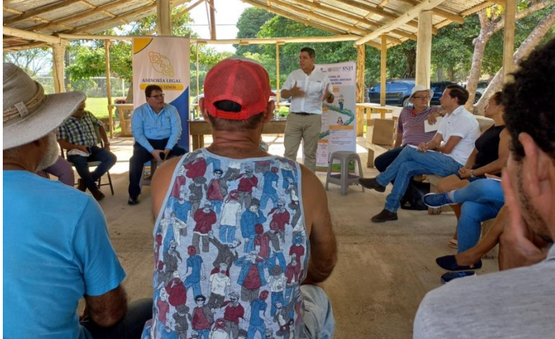
Fotografía No. 19. Encuentro entre autoridades judiciales y ciudadanía. El Carmen de Nandayure de Guanacaste. Marzo de 2023.