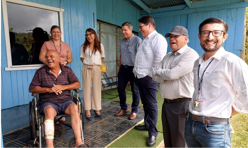
Fotografía No. 20. Encuentro de autoridades judiciales con personas facilitadoras judiciales. Montes de Oro de Puntarenas. Junio de 2023.

Como parte de las actividades ordinarias para el fortalecimiento del SNFJ, en Zona Norte se realizaron capacitaciones y charlas en centros educativos con el fin de concientizar sobre la temática de penal juvenil, en colaboración de jueces y juezas contravencionales, la Defensa Pública, Casa de Justicia y la Fiscalía. Además de esto se realizó una capacitación de mucha relevancia sobre trata de personas.