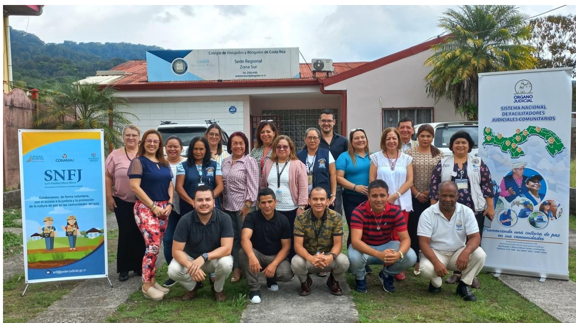
Fotografía No. 17. Encuentro presencial entre delegaciones de Costa Rica y Panamá. Ciudad Neilly. Abril de 2023.

En este sentido, se organizó un encuentro presencial en Ciudad Neilly y contó con la participación de personal profesional, judicatura, personas mediadoras y personas facilitadoras judiciales de delegaciones oficiales del Órgano Judicial de la República de Panamá y del Poder Judicial de Costa Rica. Este encuentro fue la primera experiencia de validación para la propuesta de formación construida, de forma tal, que a partir de este intercambio se aplicaron mejoras para la puesta en práctica en cada uno de los países. En el caso de Costa Rica, se puso en aplicación en mayo con 30 personas facilitadoras judiciales de todo el país. En el caso de Panamá se realizó en junio con personas facilitadoras judiciales de comunidades cercanas a la frontera de Paso Canoas.