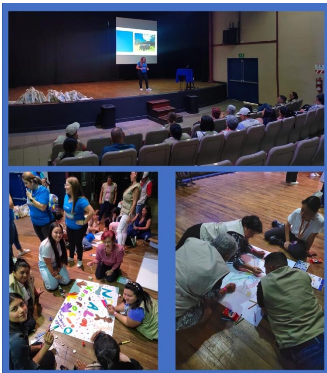
Fotografía 22. Actividades realizadas en el Día Mundial del Refugiado con personas facilitadoras judiciales y niñez. CENAC, San José. Junio de 2023.

La Subcomisión lideró un espacio de intercambio y sensibilización en donde se expuso contenidos como la protección internacional, la condición de refugio y el marco normativo nacional e internacional. En las actividades participaron personas facilitadoras judiciales de diferentes partes del país, quienes compartieron experiencias de vida con personas refugiadas, análisis y actividades lúdicas con la Red de Jóvenes Refugiados.