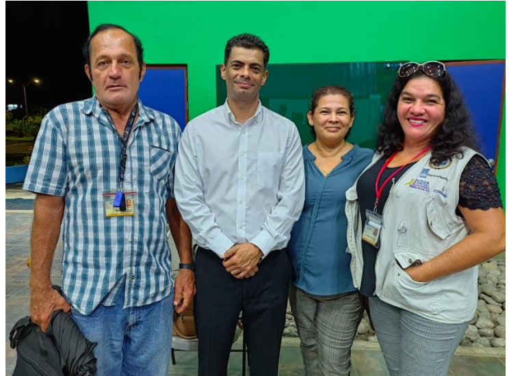
Fotografía No. 13. Encuentro de Fiscal General con ciudadanía y personas facilitadoras judiciales en La Fortuna. Octubre de 2023.

Estas acciones han permitido generar capacidades en el personal y prepararles para el diseño de un plan de acción con compromisos específicos para cada área del Ministerio Público.