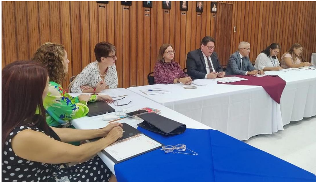
Fotografía No. 24. Sesión de Subcomisión de Acceso a la Justicia para Población Migrante y Refugiada. Mao de 2023.

Finalmente, la Subcomisión abarcó la agenda temática propuesta para el 2023 en la cual se presentaron investigaciones, proyectos y acciones claves para la actuación del grupo de trabajo y la generación de alianzas. Este año se retomaron temas como las buenas prácticas del Tribunal Administrativo Migratorio en el Interés Superior de las Personas Menores de Edad, los sistemas informáticos para la movilidad laboral, la Red Interamericana de Defensas Públicas, el Proyecto de atención a personas en condición de vulnerabilidad o vulnerabilizadas, con énfasis en personas migrantes víctimas de delito, el acceso a la justicia de las personas jóvenes en condición migratoria irregular vinculadas al Sistema de Justicia Penal Juvenil Costarricense, entre otros.