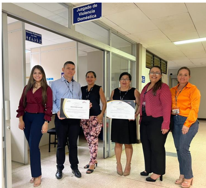
Fotografía No. 5. Personal del Juzgado de Violencia Doméstica y Protección Cautelar del II Circuito Judicial de Alajuela. Octubre de 2023.

El primer lugar se entregó al Juzgado de Violencia Doméstica y Protección Cautelar del II Circuito Judicial de Alajuela, San Carlos con el tema “La Justicia Transparente, Participativa y Colaborativa al alcance de la persona usuaria”, despacho participante en el plan piloto del Modelo de Juzgados Abiertos.