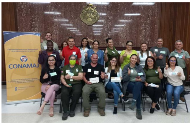
Fotografías No. 25 y 26. Taller presencial de Círculos de Paz. Mayo de 2023.

Estas personas capacitadas en círculos de paz desarrollaron aplicaciones para mejorar los ambientes laborales, unir a sus equipos de trabajo, consensuar valores institucionales, fortalecer redes colaborativas interinstitucionales y con sociedad civil, resolver conflictos entre colegas, mejorar los canales de comunicación, encontrar soluciones a retos institucionales, ejecutar reuniones efectivas, celebrar éxitos grupales y hasta para atender asuntos disciplinarios.