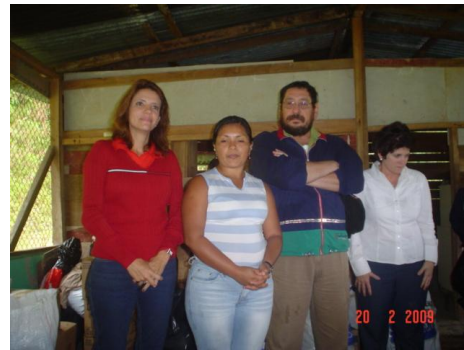
Entrega de útiles escolares en Paso Marcos

En seguimiento a los acuerdo Conamaj, de igual manera se coordinó para el mes de octubre el taller “ Acercamiento de los servicios de las Instituciones Conamaj a las personas jóvenes ”, el cual consistió en una sesión para la evaluación de portales en línea de las instituciones por 18 jóvenes del proyecto Club House de Fundación Paniamor.