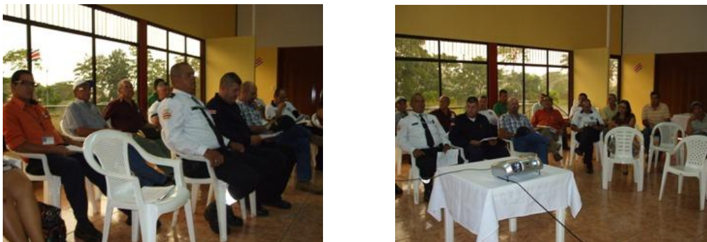
Participantes del Encuentro en La Fortuna de San Carlos

En ese sentido se informó sobre el nombramiento de dos oficiales del OIJ así como la asignación de un segundo vehículo, recursos destinados a fortalecer la presencia del Organismo en dicha comunidad; la asignación de un auxiliar judicial para reforzar el trabajo del Juzgado Contravencional; aumento de la presencia de los servicios de Resolución Alternativa de Conflictos; fortalecimiento de la coordinación entre autoridades públicas, sociedad civil y Poder Judicial; ejecución de un programa de capacitación sobre los servicios que presta el Poder Judicial y las instituciones del Sector Justicia. Se contó con representantes de la Junta Directiva de la Asociación de Desarrollo Integral de La Fortuna, Policía Turística, Ministerio de Seguridad Pública, abogados litigantes, representantes hoteleros; ocasión que permitió consolidar el compromiso de continuar acciones conjuntas en beneficio de los/las ciudadanas/nos de la comunidad de La Fortuna.