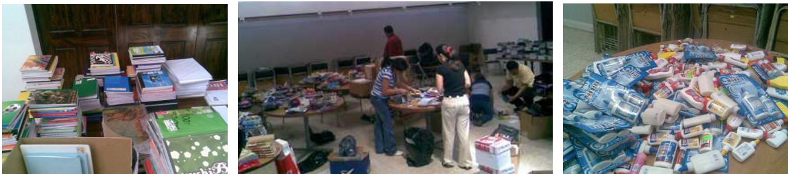
El Colegio de Abogados fungió como centro de acopio de todos los útiles recaudados.

Uno de los ejemplos más claros de esta coordinación ha sido el proyecto “ Justicia al servicio de la Educación ”, donde por segundo año consecutivo Conamaj llevó a cabo la campaña de recaudación de útiles escolares para escuelas indígenas de Turrialba. Este año Conamaj contó con el apoyo de todos sus Miembros, cuyos representantes en Acuerdo No. 019-2008 de la Sesión VII-08, decidieron integrarse en esta noble actividad lo que amplió nuestra capacidad de ayuda.