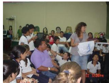
Intercambio con la Asociación de Desarrollo de La Fortuna y estudiantes de la Escuela de Pital.