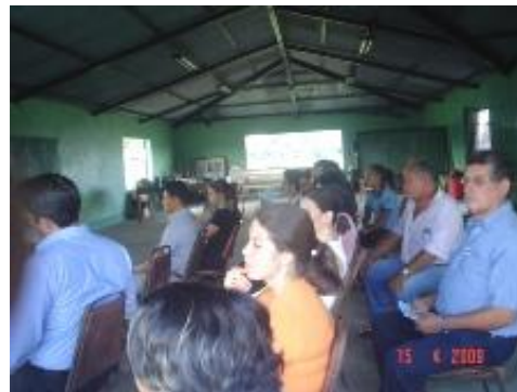
Encuentro en Guatuso el 15 de abril

El 17 de abril representantes de Conamaj y del Comité Asesor de Asuntos Indígenas del Poder Judicial visitaron la comunidad Maleku en Guatuso para presentar el informe de avance del programa y el informe de aprobación de las Reglas de Acceso a Justicia para población indígena de la Corte Suprema de Justicia.