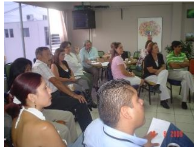
Charla sobre Justicia Restaurativa y Círculos de Paz dirigida a profesionales en Derecho del PANI.