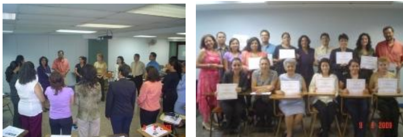
Acto de graduación de acompañantes de Círculos de Paz. Junio 2009.

Actualmente, Conamaj cuenta con este nuevo grupo de acompañantes en Círculos, el cual viene a fortalecer a la primera generación graduada en el 2008, que incluyó a 13 profesionales del Poder Judicial que atienden conflictos laborales y asuntos disciplinarios.