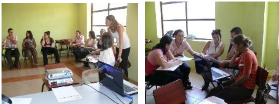
Participantes del taller realizado en Ciudad Quesada

El Servicio Jesuita para Migrantes en Costa Rica se encuentra impartiendo dichos talleres a instituciones gubernamentales, ONGs y organizaciones de la sociedad civil que se relacionan con personas migrantes en el país. Además facilitan el trámites como la inscripción de menores en el Consulado Nicaragüense y el Registro Civil en Costa Rica y Nicaragua, el acceso a documentación sobre partidas de nacimiento, récords de policía y títulos autenticados de educación en primaria y secundaria, entre otros servicios.