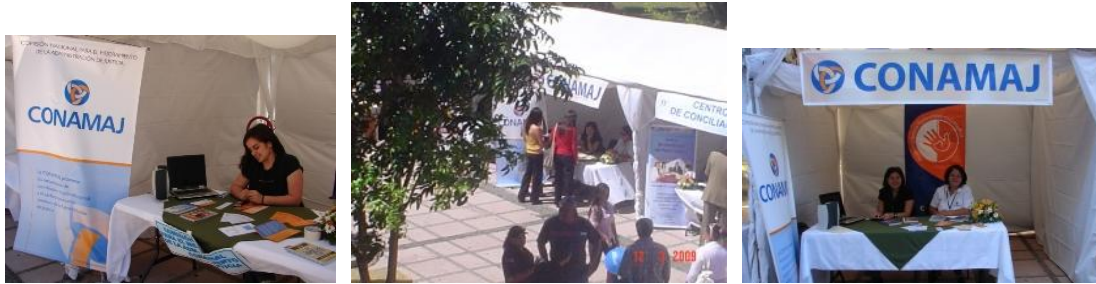
Toldo informativo de Conamaj en la Feria

La Feria se realizó del 11 al 13 de marzo y coincidió con la realización de la Cumbre, por lo que también fue una oportunidad de mostrar las acciones institucionales a Magistrados de toda América.