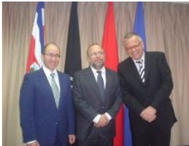
Expertos alemanes junto al Fiscal General

Cuando se visitó el Ministerio Público, el Fiscal General Francisco Dall’Anese destacó la reciente incorporación al seno de la Fiscalía el componente de comunicación con mira a agilizar y fortalecer el manejo de la información proveniente de esta instancia judicial.