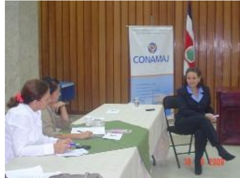
Foro de Comunicadores del Poder Judicial