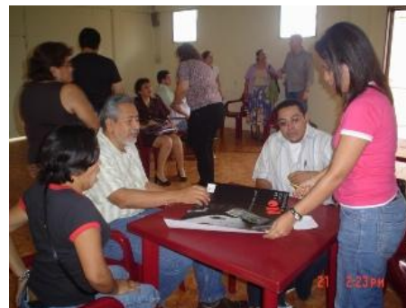
Intercambio con la Red de Organizaciones de la Zona Norte.