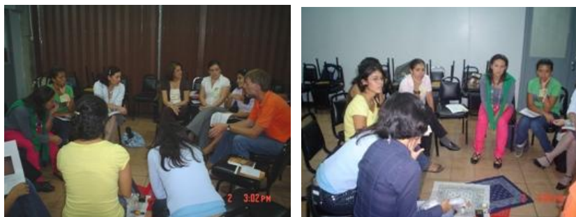
Participantes de la Jornada realizando ejercicios de Círculo de Diálogo

Estas jornadas se centraron en propiciar espacios vivenciales de aprendizaje, reflexión e interacción para la resolución alternativa de conflictos como eje fundamental en la construcción de una cultura de paz. Lo anterior con la intención de permear en distintos ámbitos sociales y lograr un proceso de transformación de actitudes y prácticas sociales acordes con una cultura de paz. Estas invitaciones siempre son acogidas por Conamaj porque representan valiosos espacios de intercambio y difusión de nuestro quehacer, específicamente del Programa de Justicia Restaurativa.