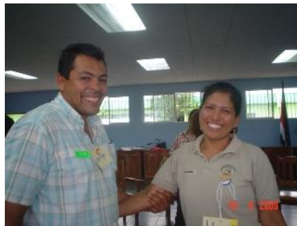
Participantes en el Círculo de Paz, en representación de la Municipalidad de Upala y el Ministerio de Salud.

En el encuentro se logró, por medio de una metodología de círculo de diálogo, conversar sobre los tipos de acercamiento de las personas migrantes al Poder Judicial, obteniendo insumos para retroalimentar la labor que se realiza en el marco del Programa de Promoción de la Participación Ciudadana en la Administración de Justicia, y para el proceso de elaboración de una Política de Acceso a la Justicia por parte de las Personas Migrantes y Refugiadas en el Poder Judicial.