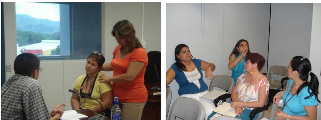
Taller contra la revictimización en Turrialba

El abordaje metodológico se basó en un diálogo reflexivo sobre la práctica cotidiana de los servidores judiciales, con miras a generar un análisis del servicio brindado a la población menor de edad víctima o testigo de un proceso judicial que conlleve a una disminución en los tratos revictimizantes hacia esta población.