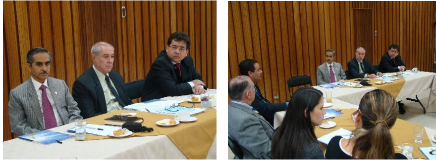
Representantes de Alto Nivel del Gobierno de Perú