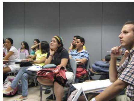
Charla del Observatorio a estudiantes de comunicación en universidades