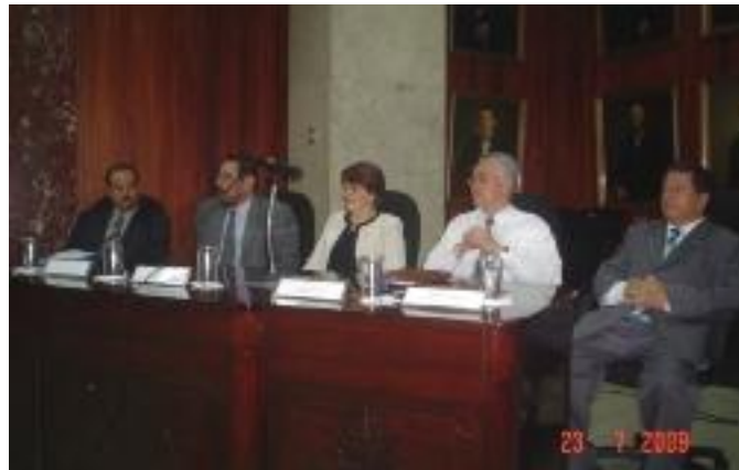
Integrantes de la mesa principal en el acto de presentación de la política de acceso a justicia para personas menores de edad en proceso penal juvenil

El documento completo sobre la Política de Acceso a Justicia para Personas Menores de Edad en Proceso Penal Juvenil puede ser consultado en las páginas de Internet de Conamaj www.conamaj.go.cr y Unicef www.unicef.org/costarica