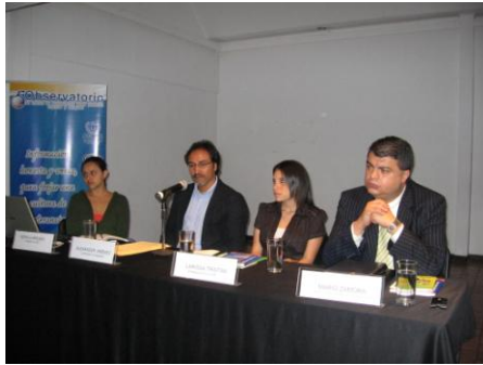
Acto de presentación del Informe de Noticias 2008