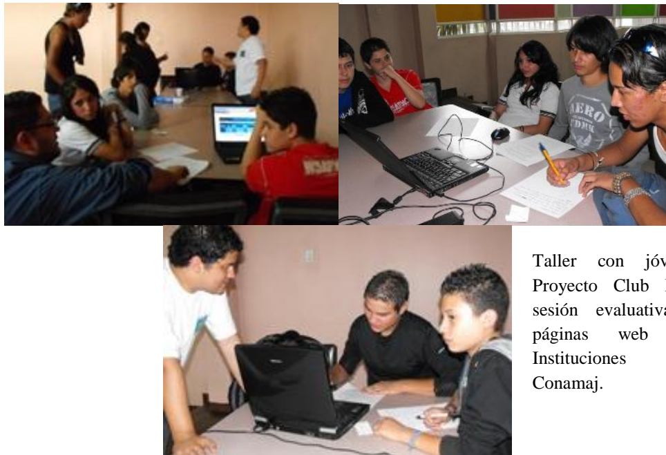
Taller con jóvenes del Proyecto Club House en sesión evaluativa de las páginas web de las Instituciones Miembro Conamaj.

La Dirección Ejecutiva de Conamaj agradece el apoyo de las instituciones participantes en esta actividad y espera que las opiniones expresadas durante el encuentro sirvan para mejorar el acceso a información para jóvenes en el sector justicia.