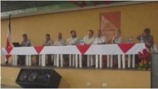
Mesa Principal integrada por máximas autoridades del Poder Judicial en La Fortuna de San Carlos