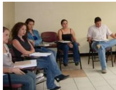
Comunicadores participantes del Taller de Oratoria