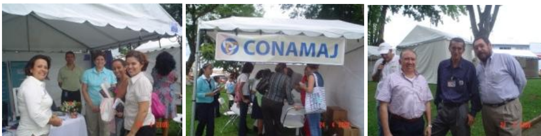
Feria de Usuarios en Ciudad Quesada