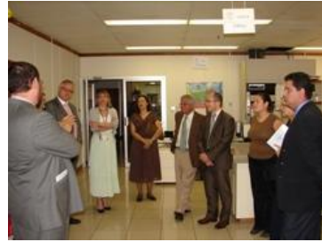
Delegación durante visita a instalaciones del Complejo de Ciencias Forenses