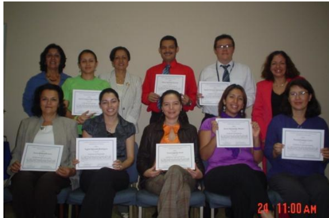
Graduación de Círculos de Paz de funcionarios y funcionarias del Juzgado de Niñez y Adolescencia y de oficinas locales del Pani

El acto de graduación del grupo de personas participantes de este proceso del Juzgado de Niñez y Adolescencia y de oficinas locales del Patronato Nacional de la Infancia se realizó el 24 de noviembre.