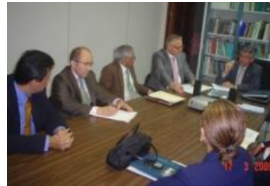
Delegación alemana en reunión con Defensor Adjunto de los Habitantes y Director de del Organismo de Investigación Judicial

Con respecto a las charlas presentadas por los encargados de prensa, éstas tuvieron como objetivo presentar a los expertos alemanes la forma de trabajo y estrategias de comunicación aplicadas por estas dependencias en su relacionamiento con los medios de comunicación, así como con públicos internos de las instituciones involucradas.