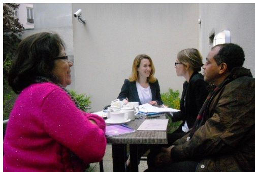
Reunión con jueza del Tribunal Administrativo Francés para Refugio.

La plataforma de servicios integrados con que cuentan estos puntos de acceso al derecho varía en cada lugar, de acuerdo a las necesidades y características de las poblaciones, los cuales pueden ir desde información sobre trámites y procedimientos para la regularización migratoria, derechos y responsabilidades como habitante de ese país, hasta temas como salud reproductiva, asesoría legal y psicológica o educación lingüística. Los puntos de acceso al derecho son descentralizados, con gran participación de los gobiernos locales y en algunos casos hay participación del sector privado.